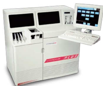
全自動生化学測定システム