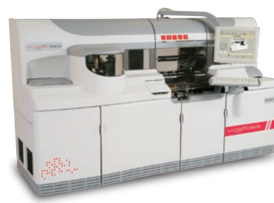
全自動免疫生化学統合システム